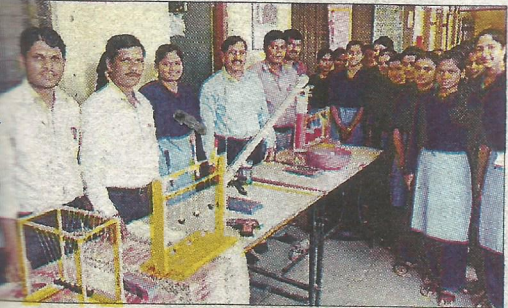
जीराजे विद्यालयातील विज्ञान प्रदर्शन पाहताना मान्यवर.